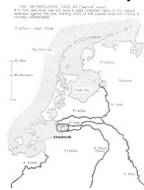
NL 1000 AD