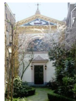
schuilkerk Maria Major kerk Voorstraat

Een scala van buitenlandse Religieuzen hebben Dordrecht beïnvloed. Walén, Engelse en Nederduitse gereformeerden. Zij bestonden uit immigranten van de Franstalige Nederlanden en Engelse en Schotse calvinisten. Lutheranen kwamen uit het Duitse. Al deze groeperingen hadden invloed op de sociaal culturele elite.