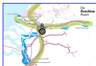
Stad aan Europese corridors