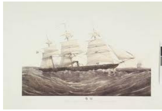
Kayiyo-Maru - Japan

Al deze voorbeelden geven de Internationale invloeden aan in Dordrecht.