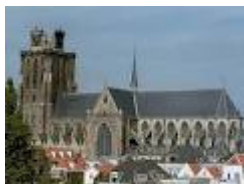
Grote Kerk Dordrecht