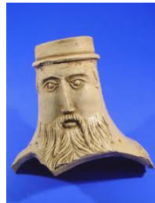
baardman kruik, aardewerk uit Duitsland

De Vijzel gemaakt van kalksteen afkomstig uit Caen ( Normandië Frankrijk ) Deze steensoort werd in de 13 e eeuw intensief geëxporteerd naar Engeland, de Nederlanden, Denemarken en de westkust van Noorwegen.