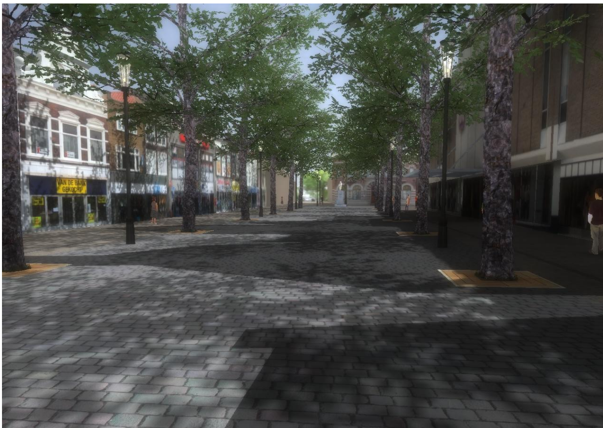
Bagijnhof rond 2013

Of het huidige ontwerp weer de zoveelste gedaantewisseling is van de Bagijnhof? Ik denk het wel, en weet ook zeker dat er nog vele gedaantewisselingen gaan komen.