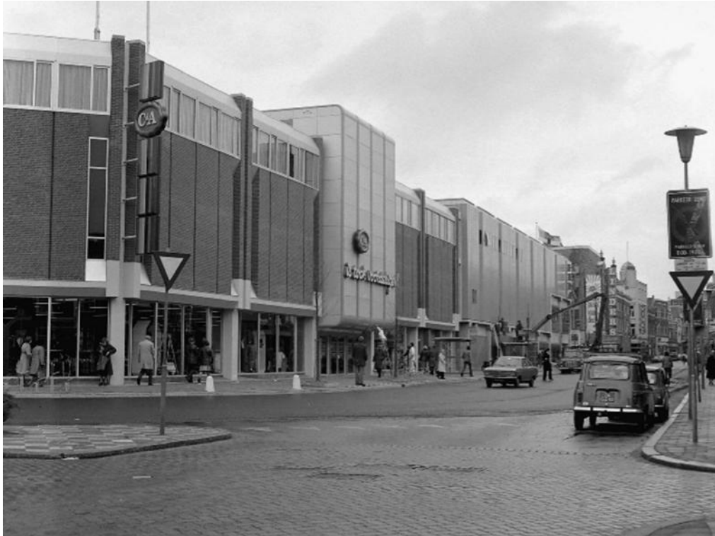
Bagijnhof rond 1980

protesteerden tegen de sloop, was de toenmalige burgemeester van mening dat het postkantoor niet meer in het moderne Dordrecht paste. Binnen no time stonden modernistische gebouwen, in een soort neo-beton-ancestijl zoals, de HEMA en C&A op zijn plaats. Ook hier was een momentopname bepalend voor het uiterlijk vertoon van het Bagijnhof.