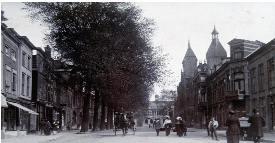
Bagijnhof rond 1920