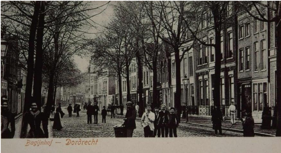
Bagijnhof rond 1900