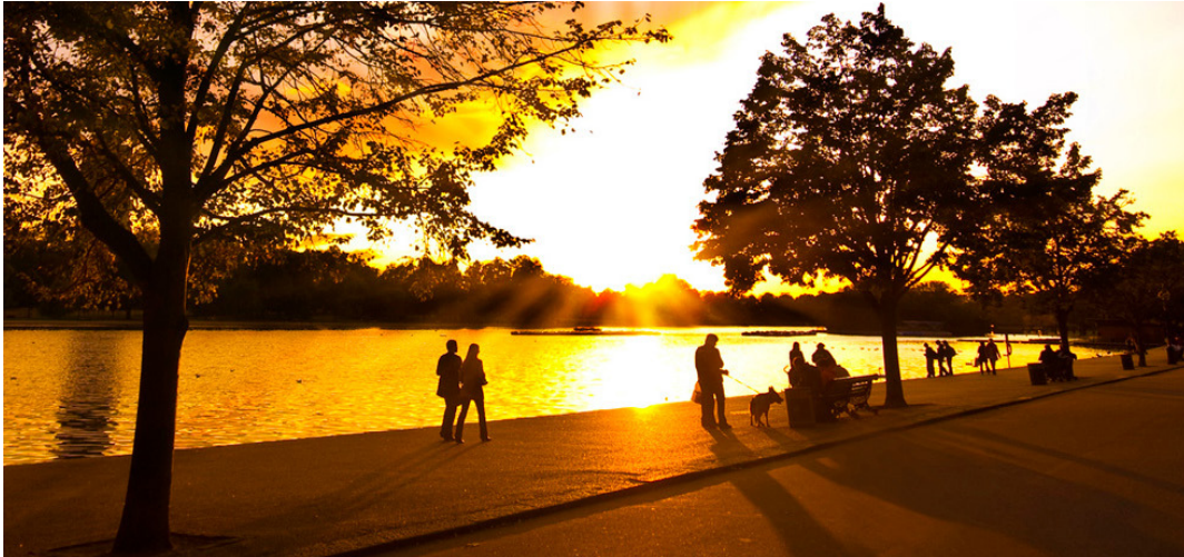
Voorbeeld foto ter inspiratie

Het gebied zou als rivierenpark kunnen worden ingericht dat gelegenheid biedt om langs het water te wandelen of te barbequen. Daarvoor is uiteraard vertrek van het tankstation een belangrijke voorwaarde (maar waar een wil is, is ook een weg).