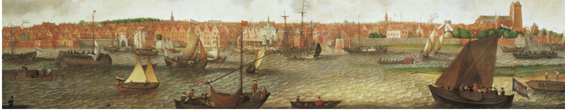
Willaerts, Gezicht op Dordrecht (uitsnede)

Ik kijk even met de kunstenaar mee. Het is misschien rond 1500 dat wij zo staan te kijken en vanuit het randje van het eiland kun je zelfs Gorcum en Geertruidenberg zien aan de andere kant van het water, de waterbus van toen draait overuren. Op het water lijkt het wel Canal Grande di Venezia op een drukke zomeravond en er gebeurt van alles, drukte met boten, de bedrijvigheid is enorm, graan, wijn, hout, alles komt langs. Het is net een theater wat we zien, alles wordt uitgepakt en verhandeld, de granen onder de schaduw van de Grote Kerk. Gelukkig hangen de stoflappen klaar aan de grote ogen in de kerkmuur, zodat de graan tijdens plotse regenbui meteen bedekt kan worden.