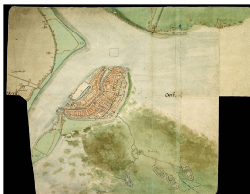
Kaart van Dordrecht (bron onbekend) / rechts: kaart van Jacob van Deventer 1565