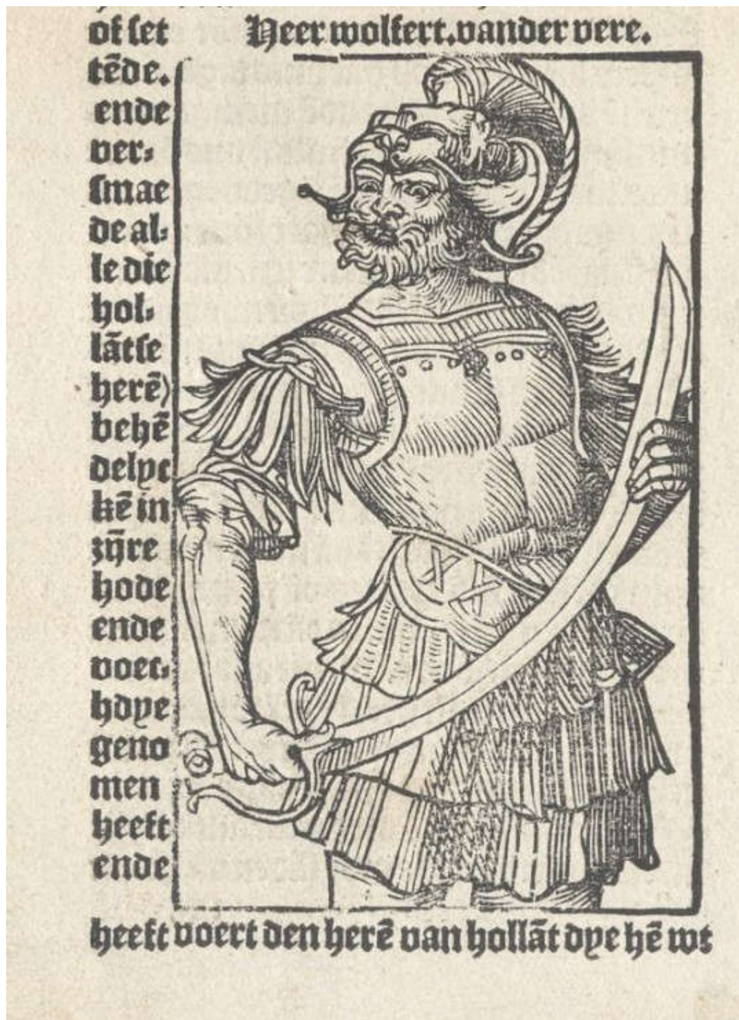
Wolfert Van Borselen ('Heer Wolfert Vander Vere') in de Oude Chronyck van Hollandt, een druk van de Divisiechroniek van 1517