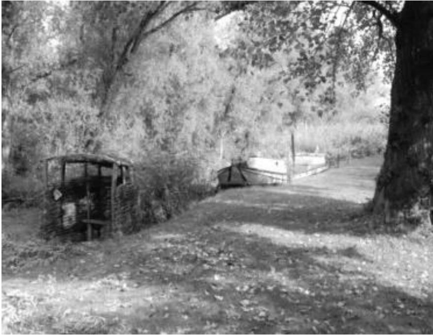
Den aoi en griendaak

Er is nog veel "oude" Biesbosch over gebleven. Het mooiste stukje vind je op de "Sterlinggriend". En dat nog wel op nog geen kilometer van de stad! Een woekerend en jungleachtig gebied dat met laag water eruit ziet als een mangrove maar ook percelen met verschillende soorten wilgen. De zogenaamde hakgrienden . In de "Sterlingkeet", een stenen griendwerkershuisje, dat wordt beheerd door een paar enthousiaste vrijwilligers, is alles, zoals het in de tijd van de griendwerkers was, gebleven of weer in ere hersteld. Het is een open luchtmuseum met boven de greppel "den aoi" (de wc) waar je alle hoop kan laten varen en een griendaak, een historische boot uit de jaren 20 van de vorige eeuw, voor het vervoer van voornamelijk riet maar ook bies en wilgenhout.